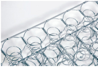
Muelles Double Offset 25% más de muelles